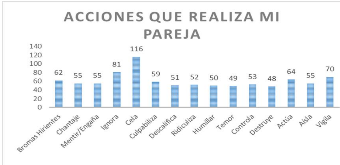
Figura 1. Acciones que más presentan las parejas (primera etapa)

de realizar un acto activo, y que las mujeres se sienten mal y ellas son las que intentan reconciliar, aun no teniendo la culpa.