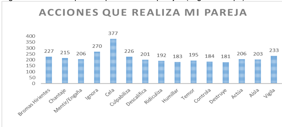
Figura 2. Acciones que más presentan las parejas (segunda etapa)